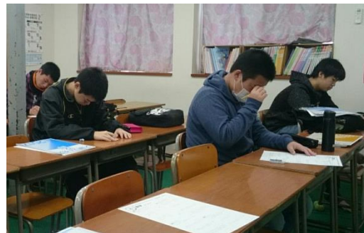
パーフェクトゼミ風景

2学期より、中学3年生を対象に入試必勝パーフェクトゼミを行います。入試に向けて、基礎問題の反復練習から応用問題への挑戦まで、数多くの問題に取り組む特別授業です。後半ではテスト形式の実践問題に徹底して取り組み、入試に対する不安を失くし自信を持たせます。「これだけのことをやったんだ。」という気持ちが、合格を勝ち取る大きな自信になります。