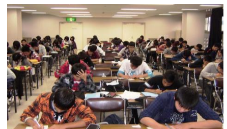
(国立吉備青少年自然の家にて)

中学受験をする小学 6 年生と中学生を対象に、年 1 回に 1 泊 2 日の勉強合宿を行います。泊まり込みで勉強漬けの 2 日間を過ごし、真の学習とは何かを体得し、秋以降の飛躍の足掛かりを得るのに大変役立っています。